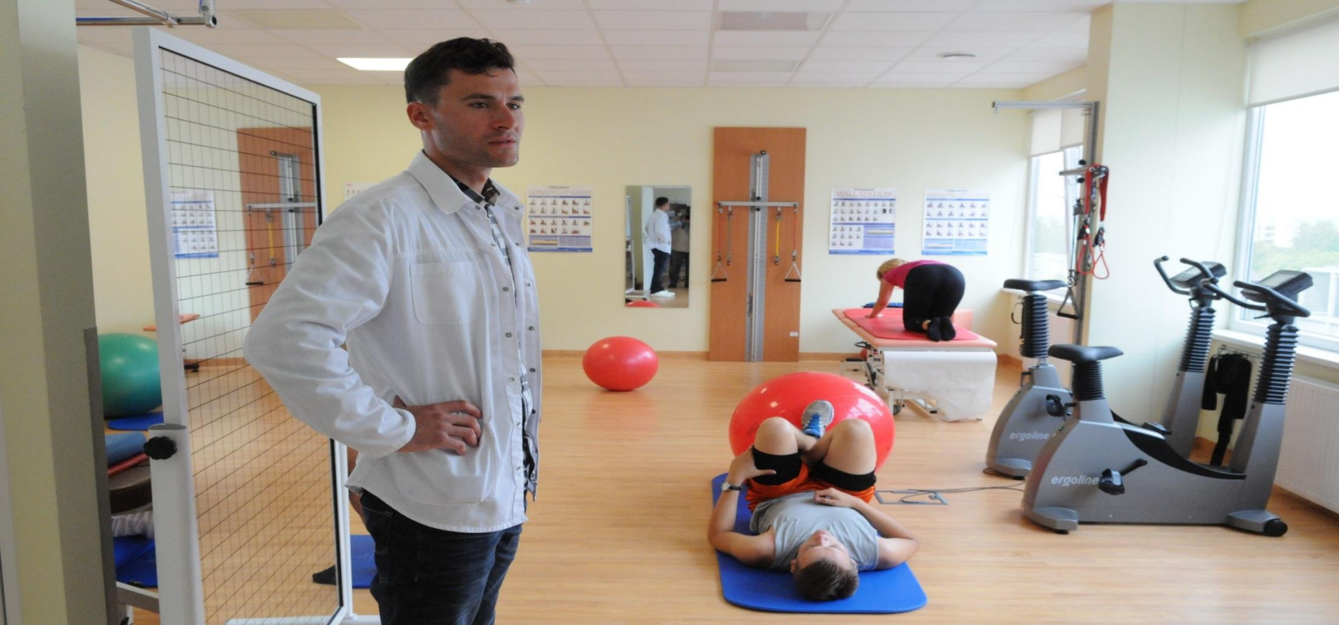
Teikiamos reabilitacijos ir sporto medicinos paslaugos.