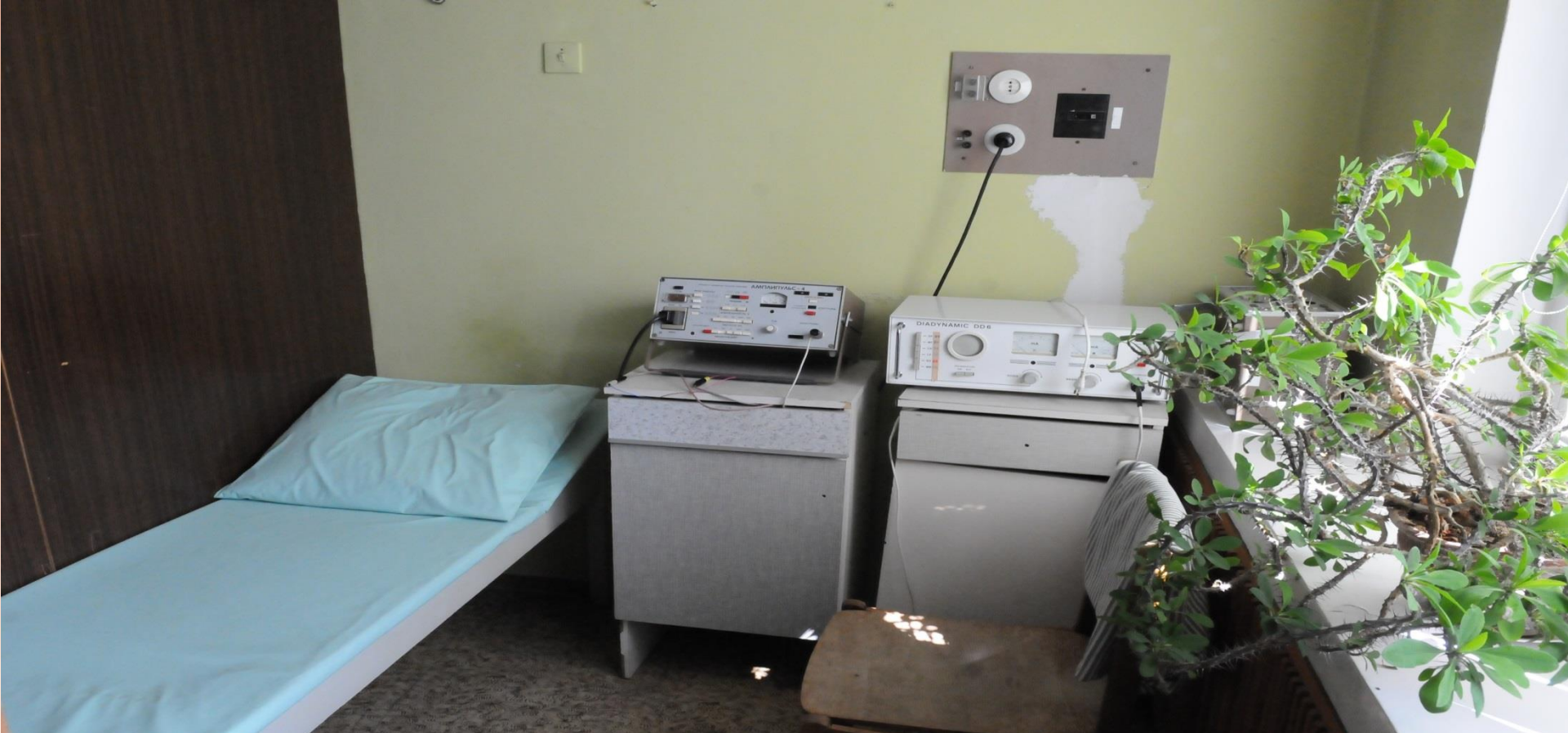
Buvusio Ambulatorinės reabilitacijos skyriaus darbo sąlygos.