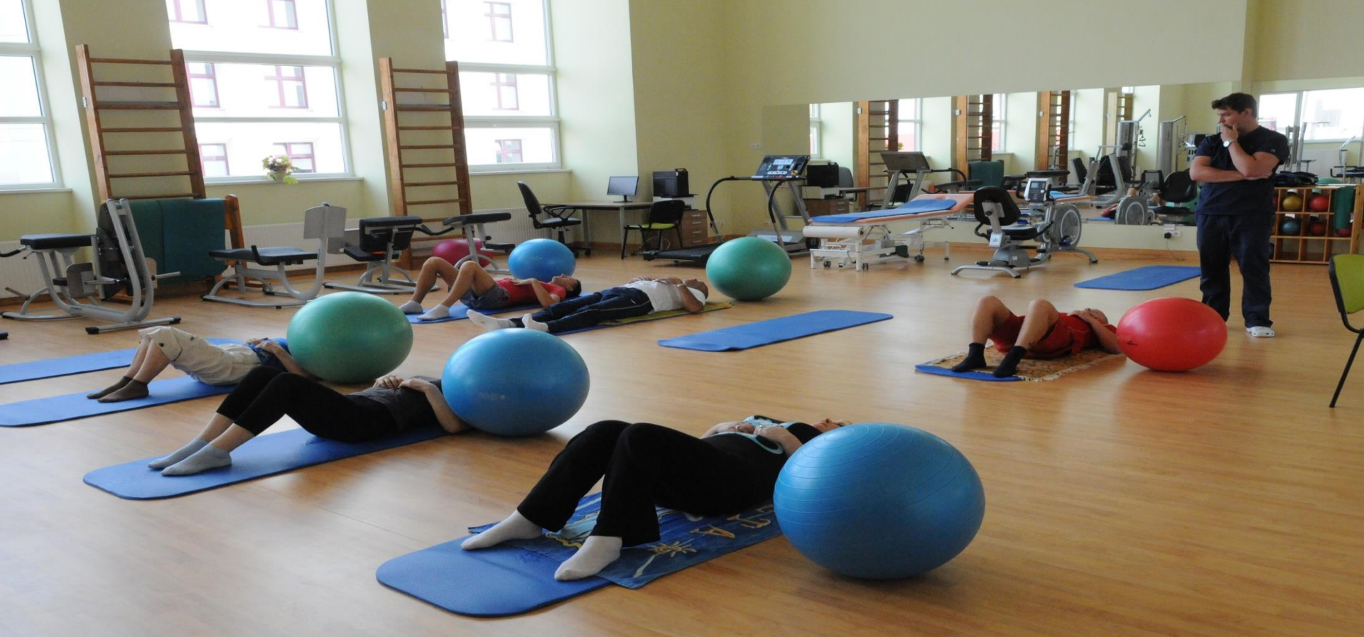
Puikios sąlygos pacientams, atnaujinta medicininė įranga ir inventorius.