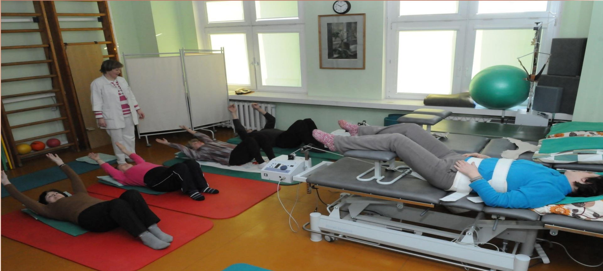
Ambulatorinės reabilitacijos skyrius buvo per ankštas saugioms ir kokybiškoms paslaugoms teikti.