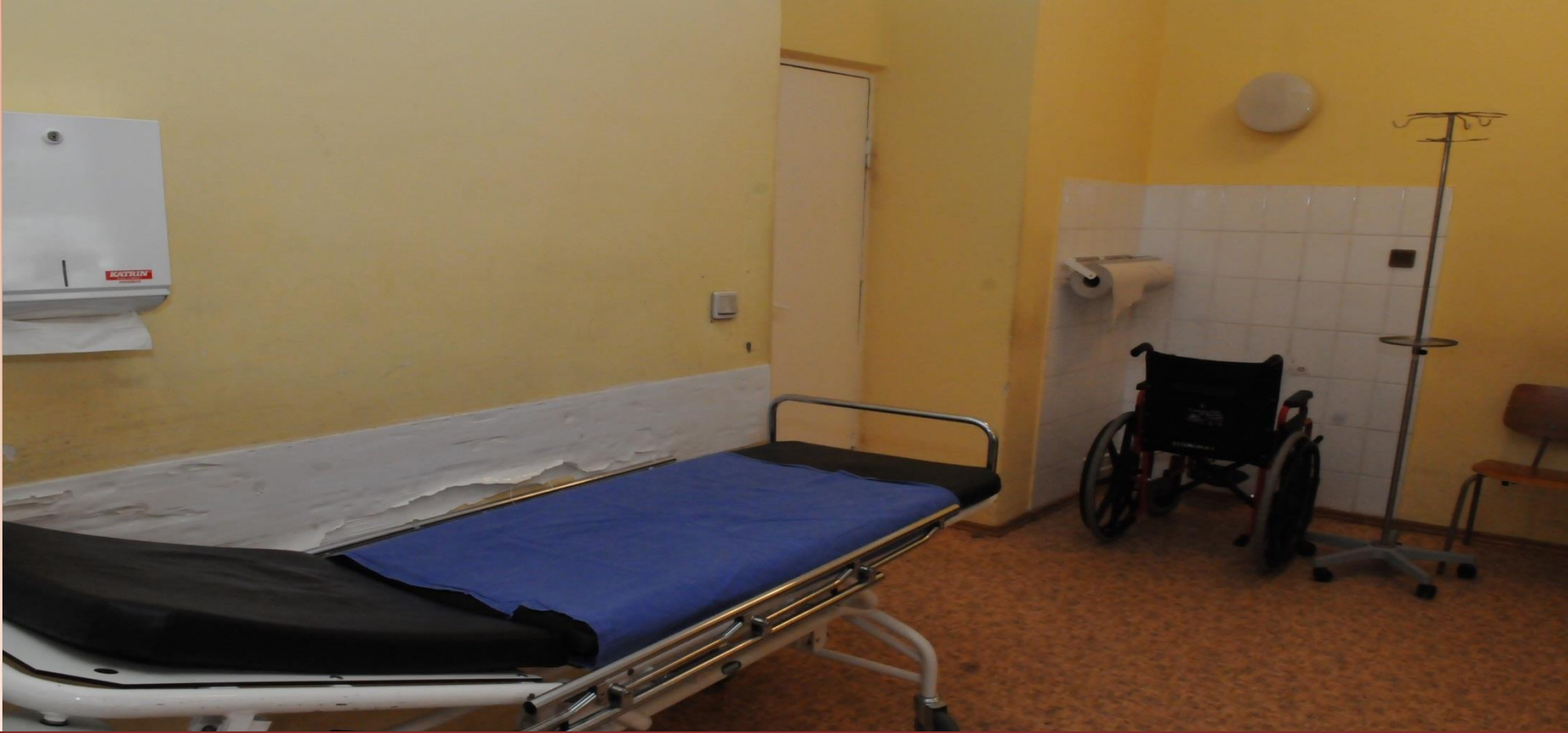
Iki 2010 m. buvo vykdomi tik kosmetinio remonto darbai.