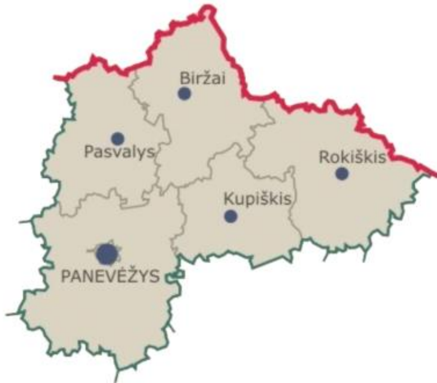
Panevėžio apskrities savivaldybių ribos