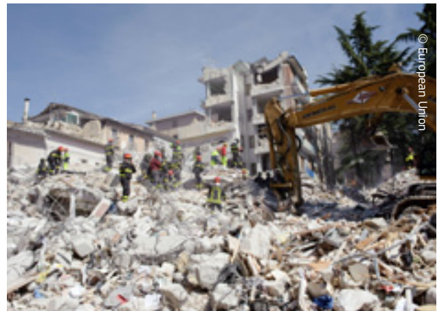
2012 m. po Emiliją-Romaniją sukrėtusių žemės drebėjimų Italija iš ES solidarumo fondo gavo 670 mln. eurų.

Didžioji dalis lėšų buvo skirta padengti skubios pagalbos, gelbėjimo operacijų ir laikino apgyvendinimo išlaidoms. Apie 292 mln. eurų buvo skirta nedelsiant