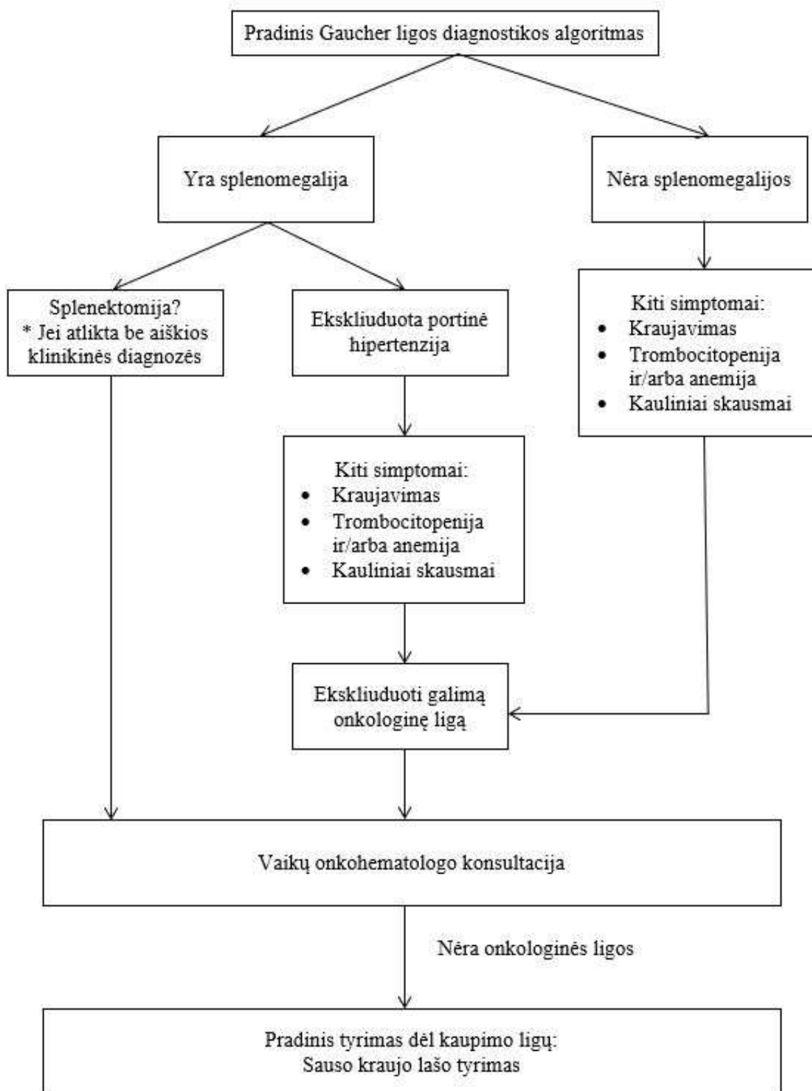
Paveikslas 2: Gaucher ligos diagnostikos algoritmas vaikams.