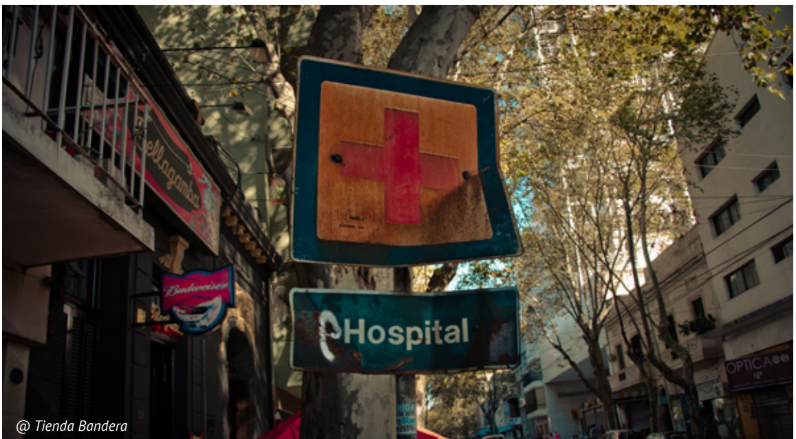
@ Tienda Bandera

Tačiau vis tiek, jei pradėdame vystyti šį klausimą, vadinasi, humanitarinė organizacija privalo ne tik išsaugoti gyvybę ir orumą, bet ir atliepti švietimo poreikius, teisę į mokslą. O kas tuomet apibrėžia mokymo programos turinį? Kaip mokant apibrėžti situaciją, su kuria susidūrė mokinys, kai visas pasakojimas yra susipynęs