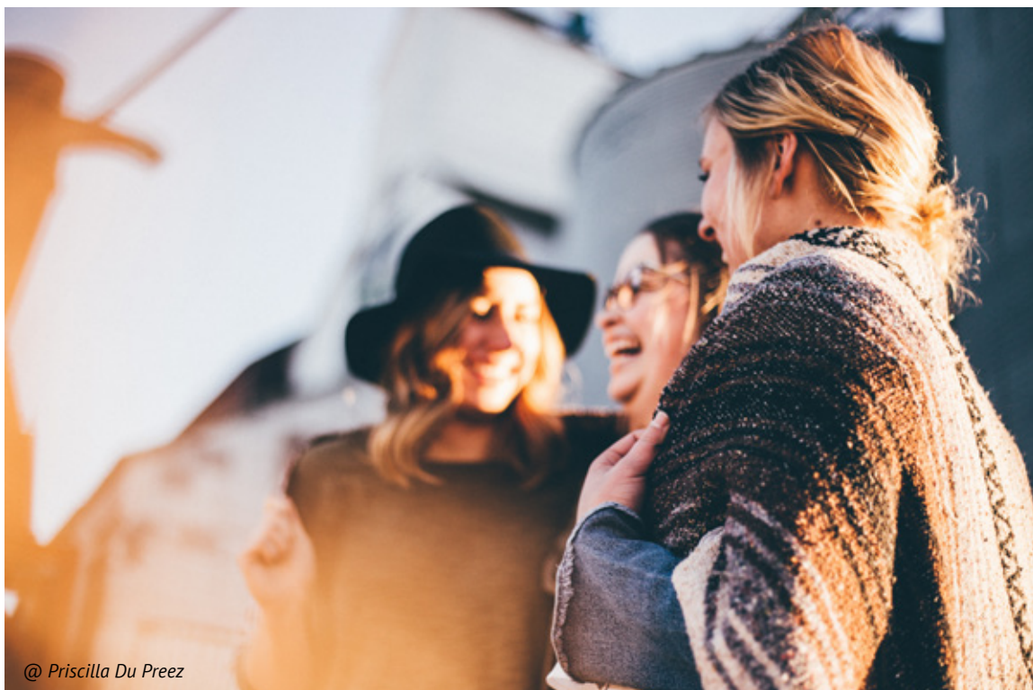
@ Priscilla Du Preez

Sirija labai skiriasi nuo Irako, o Irakas labai skiriasi nuo Afganistano. Ir vienintelis kelias išties tinkamai veikti yra įgyti strateginę lyderystę žiūrint iš JT politinės perspektyvos, suderinti su tarpvyriausybinėmis organizacijomis, vesti sąžiningą dialogą, kalbėtis su konkrečios šalies tauta ir jų vyriausybe, kaip geriausiai galime padėti vietos žmonėms. Tai nėra lengva užduotis. Žmonėms kyla pavojus patirti žalą, jie gali būti nužudyti. Ir tas pavojus kyla tiek žiūrint iš karinės, tiek ir iš humanitarinės perspektyvos. Žmonės ir toliau rizikuoja atsidurti labai sunkiose situacijose, nes jie galimai gaus pagalbą iš NVO, kurios arba dirba su kariškiais arba ne. Sprendimas, ar humanitariniai pagalbininkai leis ginkluotiems kariškiams veikti šalia jų, gali reikšti skirtumą tarp tikimybės žmonėms patekti į pažeidžiamų gyventojų grupę, arba tai net gali kainuoti jų gyvybę. Kai kuriose kompleksinės pagalbos teikimo operacijose labai lengva pasakyti, kad humanitarinės organizacijos neturėtų sąveikauti su kariškiais. Tą atskirtį galima sumodeliuoti pagal esamą situaciją. Tačiau sprendimą priima ne kas kitas, o lyderystė humanitarinėje bendruomenėje. Ir tam turi pritarti priimanti bendruomenė, kurios ribose teikiama pagalba.