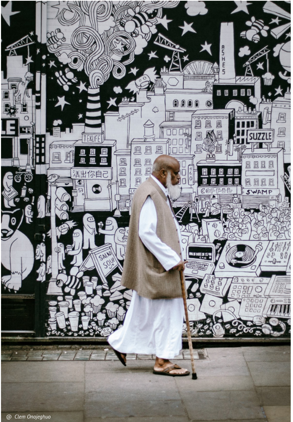
@ Clem Onojeghuo