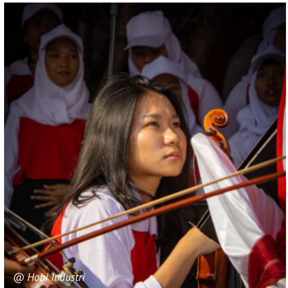
@ Hobi Industri

Taigi, būdamas humanitarinis darbuotojas, faktiškai dirbate kurdami programą. Būkite tikri, kad tai viskas, ką darote. Jei ketinate pereiti prie advokato vaidmens, būkite labai atsargūs, kaip tai darysite, ir tikrai įsitikinkite, kad tai nepakenks grupei, kurią iš tiesų bandote palaikyti, kad tai nepakenks NVO, kuriai dirbate, taip pat nepakenks kitoms NVO, esančioms toje vietoje ir atliekančioms tą patį darbą, kurį darote ir jūs. Tai reikalauja daug įžvalgų ir minčių. Manau, svarbu aptarti su visais kartu dirbančiais.