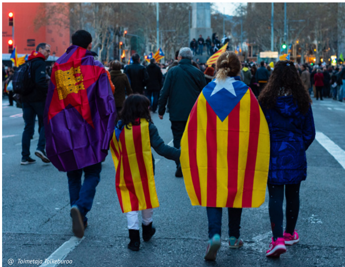
@ Toimetaja Tolkebuuro

ir medicininio darbo humanitarinėse situacijose. Kartais būna itin sunku, tuomet turiu nusibrėžti sau liniją ir pasakyti: „negaliu to padaryti, reikia pertraukos“. Kartais sunku suvokti, kad visko padaryti neįmanoma. Dirbant tiesioginėse misijose, matant visus žmones krizinėse situacijose, ir netgi darant viską, ką gali, vienam įveikti krizę yra neįmanoma. Tarkime, dirbau krizės metu Liberijoje. Buvo toks momentas, kai supratau, kad turiu vykti namo. Tiesiog buvo taip sunku asmeniškai, kad turėjau vykti namo. Tampi neefektyvus, nenori būti ten, kur esi, ir tavo mintys jau kažkur kitur. Jei pasineri į dalykus, kurių neturėtum daryti ir tik nori atitrūkti nuo kažko – tampi tiesiog neefektyvus. Neturėtume savęs atitraukti nuo vienos problemos ir perkelti į kitas, tai yra svarbus asmeninis įsivertinimas ir savęs pažinimas. Svarbu jausti ir žinoti, kad pasieki savo ribą ir duoti sau pertrauką. Taip, tai yra didelis iššūkis, nes visuomet yra ką nuveikti, visuomet yra vietų kur gali būti naudingas, ir žmonių, kuriems gali padėti, veiklų, kurias gali sustiprinti ir įgyvendinti pagalbos atveju. Ir šie darbai niekuomet nesibaigs, bet svarbu žinoti ir įvertinti savo ribas.