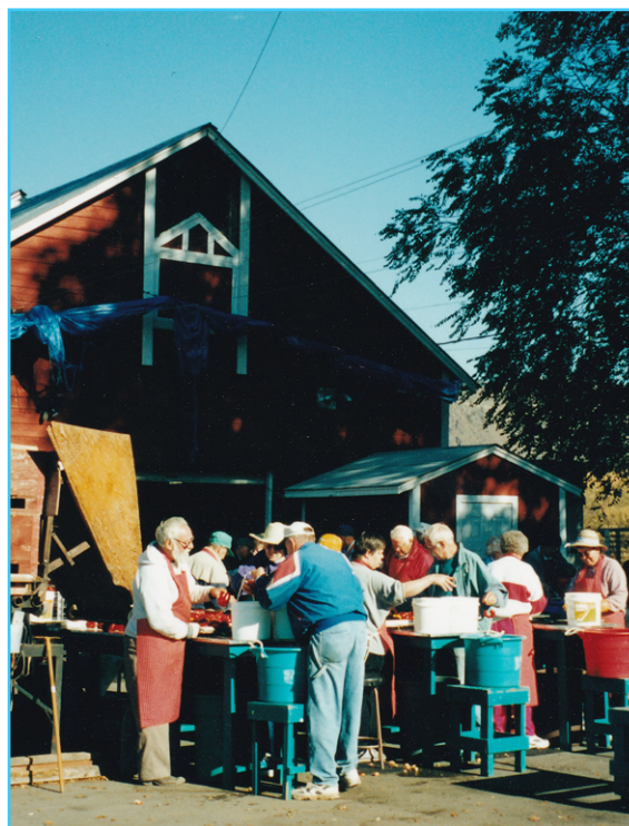
Ruošiami sausų sriubų mišiniai labdarai Kanadoje.