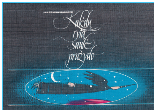
Kalėdinio renginio atvirukas

Vienas iš veiklos vykdymo pavyzdžių buvo ir rėmėjų paieškos, ir bandymai pritraukti lėšas. 1988 m. gruodį organizuotas Kalėdinis renginys, kurio tikslas – suburti žmones bendrai šventei ir pasidalinti įvairiais švenčių papročiais. Tam Fondas buvo specialiai paruošęs atvirukų, leidinių apie Kalėdas ir kitų priemonių. Šis renginys buvo mokamas, o nedidelis iš jo gautas pelnas paskirtas organizacijos veikloms finansuoti.