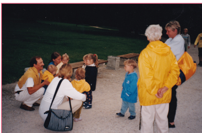
Pasivaikščiavimas po Palangos Botanikos parką.

Teikėme pagalbą ir besikuriančioms NVO. Pavyzdžiui, Fondas padėjo įsteigti bendriją „Viltis“, dalijosi savo valdymo ir administracijos principais. Kitas NVO remdavome ir materialiai arba dalindavomės patalpomis.