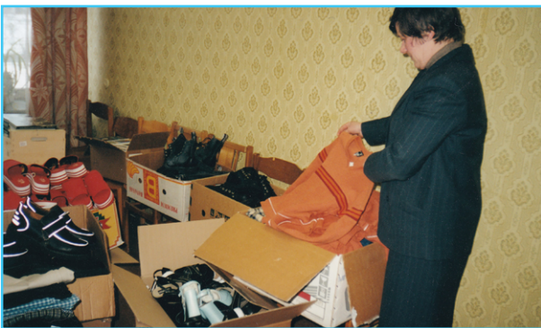
Labdaros perdavimas šeimoms ir organizacijoms.

Detali informacija apie paramą šeimynoms buvo teikiama ir tų rajonų savivaldybėms, kuriose šeimynos įsikūrė. Buvo nurodomos konkrečios paramos sumos ir jų teikimo laikotarpiai. Tai – ne tik skaidrumo principo laikymasis, bet ir informacijos viešumas tiek šeimynų, tiek savivaldybių atžvilgiu. Skaidriai paviėšinus Fondo suteiktą paramą, savivaldybės iš savo pusės galėjo įvertinti situaciją ir taip pat prisidėti prie visų šeimynų poreikių užtikrinimo.