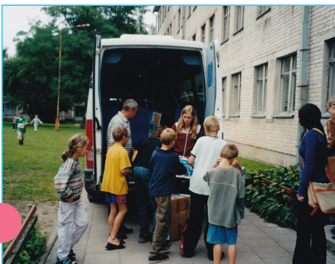
Labdara perduodama Trakų vaikų globos namams.