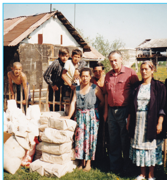
Maisto perdavimas Romų šeimoms.

Centre romų vaikai buvo paskirstyti į dvi grupes: darželio ir priešmokyklinę. Taip pat buvo teikiamos socialinių darbuotojų paslaugos šeimoms, dirbo bendrosios praktikos gydytojas ir vaikų pediatras. Ilgainiui šios veiklos buvo integruotos į kitas mokymo įstaigas.