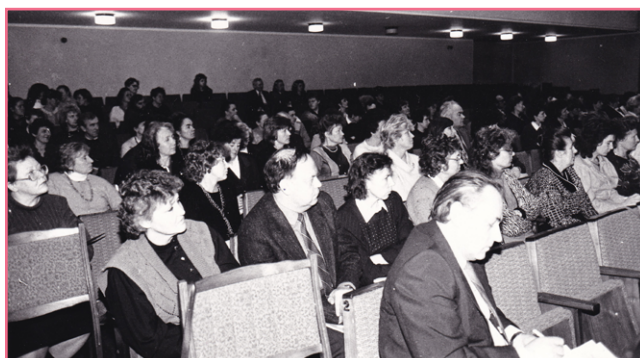
Kasmetinės atskaitomosios konferencijos akimirka.

Tuomet, pradėjus ir humanitarinę veiklą, Fondas išgyveno ir praktinius naujakurio iššūkius: rasti tinkamas patalpas, baldus (jų laisvai gauti tuo laikotarpiu buvo beveik neįmanoma, tik pagal vadinamuosius „talonus“), kitą reikalingą įrangą – tokie praktiniai dalykai sukėlė daug sunkumų. Be to, buvo sunku rasti ir darbuotojų, turinčių patirties šioje sferoje ir suprantančių jos specifiką. Pradėjus humanitarinę veiklą, reikėjo mokytis ir skaidrumo principų – pvz., gavus piniginę auką, rašyti ne tik ataskaitos dokumentai, bet ir padėkos laiškas aukotojams – kad jie būtų ramūs, jog jų auka gauta.