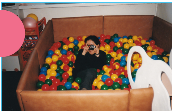
Rėmėjų dovana - burbulai, sensoriniam kambariui Druskininkų „Saulutė“ sanatorijoje