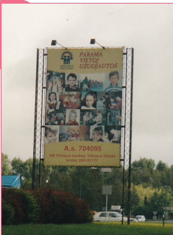
Viena iš pirmųjų socialinių reklamų Lietuvoje.

Tiek valdyme, tiek veiklose vienas iš Fondo tikslų yra kurti ir stiprinti partnerystes. Į seminarus, konferencijas ir renginius kviesdavome skirtingų sektorių atstovus – praktikus ir sprendimų priėmėjus, rėmėjus bei žmones, kuriems skirtos mūsų veiklos.