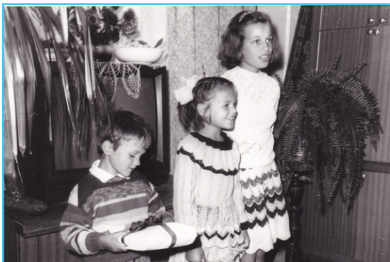
Šeimynos vaikai, kuriems padėjo rėmėjai.