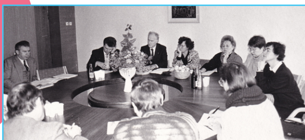
Susitikimas su partneriais iš Latvijos ir Estijos.