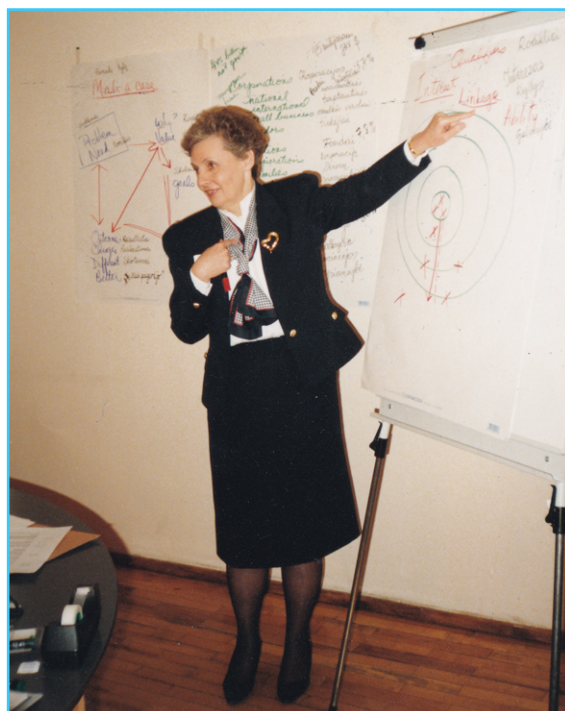
Fondo kvietimu užsienio ekspertai dalijosi patirtimi ir mokė Fondo ir kitų NVO darbuotojus ir savanorius.

Bendradarbiavimas su miestų ir rajonų vaiko teisių apsaugos tarnybomis. Valdžios įstaigų rekomenduoti vaikai paramai gauti ją gaudavo. Kas ketvirtį Fondas teikdavo valdžios institucijoms ataskaitas apie vaikų globėjams pervedamas lėšas ir toliau bendradarbiaudavo su savivaldybėmis ir šeimomis, siekiant užtikrinti efektyviausią pagalbą ir užtikrinti esamų poreikių patenkinimą.