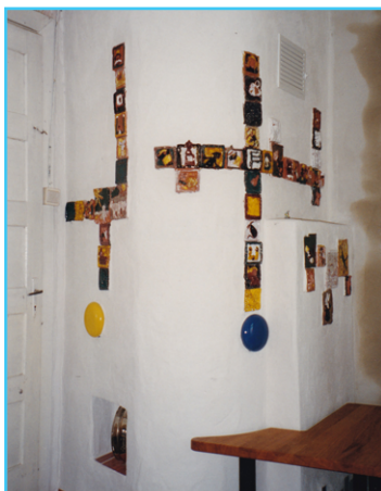
Pirmosios įrengtos krosnys programos „Šiluma vaikams“ metu.