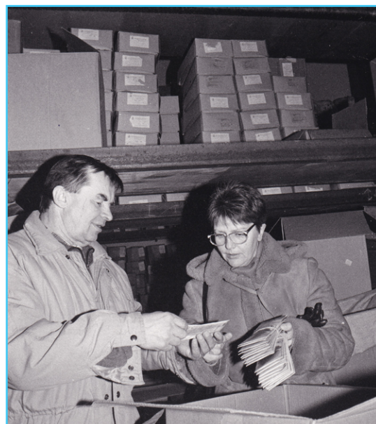
Sandėlyje skaičiuojama labdara.