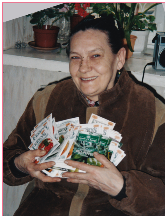
Šeimos džiaugiasi dovanotomis daržovių sėklomis.