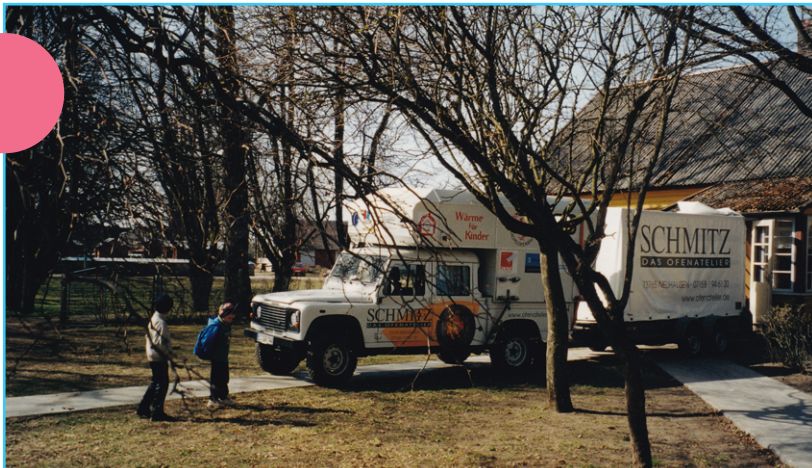
Pirmieji krosnių statytojai Mosėdžiuose.

Panaudojant Krikščioniškojo vaikų fondo (Ričmondas, JAV) patirtį su organizacija „Saulutė“ (Čikaga, JAV) pradėjome individualios paramos vaikams programą. Nuo 1994 m. iki dabar rėmėjų paramos sulaukė 506 vaikai. Šios programos metu donorai gali siųsti papildomą paramą tiesiogiai jos gavėjams ir/arba juos lankyti, nes turi tiesioginius jų kontaktus.