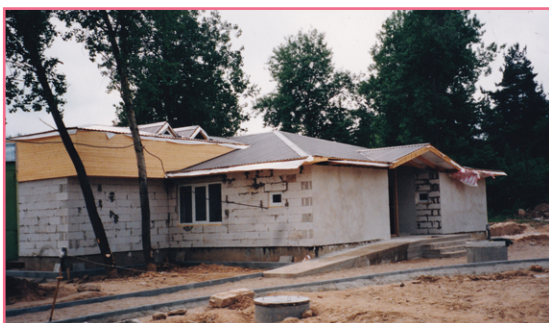
Romų visuomenės centro statyba.