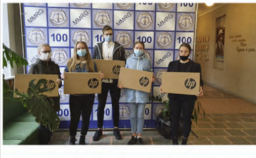
2020 m. veiklos ataskaita: ilgalaikių programų ataskaita.

Ilgalaikė paramai vaikams 2020 m. panaudota 50 660,01 Eur, šeimų ir kitų organizacijų paramai – 27 543,00 Eur.