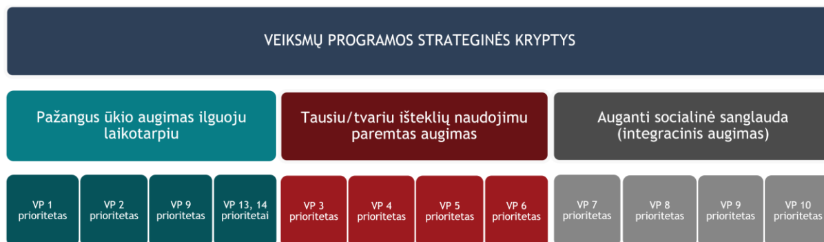
2 PAVEIKSLAS. VP 3 STRATEGINĖS KRYPTYS IR ATITINKAMI VP PRIORITETAI

Atliekant regioninę atvejo studiją, analizuojamų rodiklių reikšmės (duomenys) regionų pjūviais buvo pasitelkti iš Valstybės duomenų agentūros ir EUROSTAT duomenų bazių, taip pat suteikti atsakingų institucijų (Aplinkos apsaugos agentūros, Policijos departamento prie Vidaus reikalų ministerijos, LR socialinės apsaugos ir darbo ministerijos, LR vidaus reikalų ministerijos).