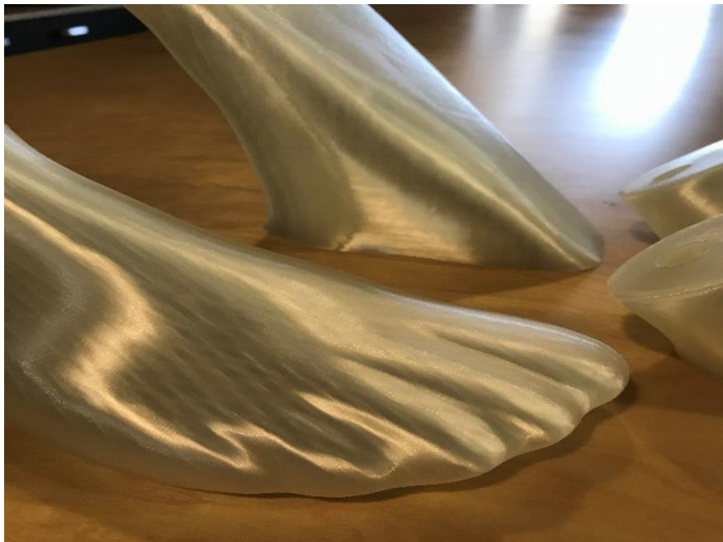
Pav. Nr. 1

Produktai, kuriuos turi būti galima spausdinti siūlomą 3D spausdintuvu: