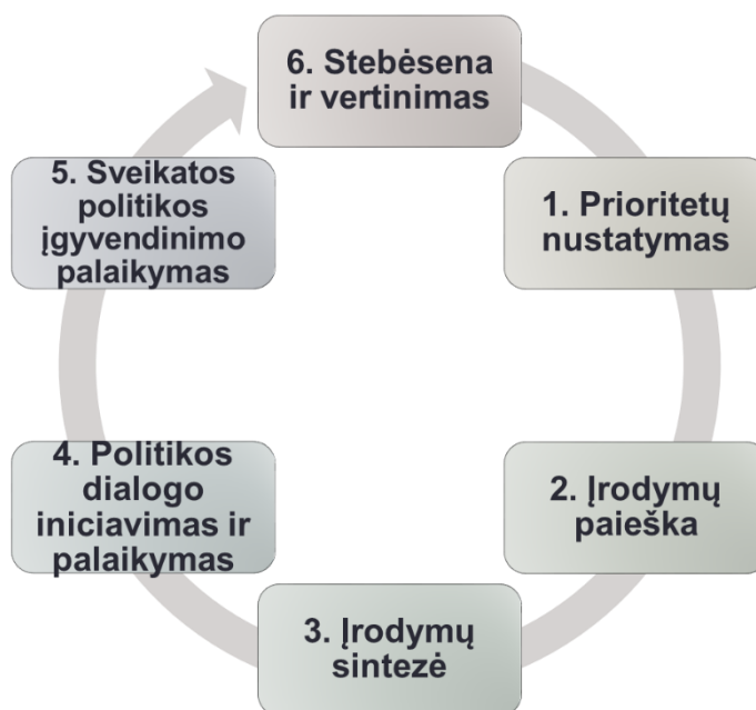
1 pav. Žinių integravimo ir perdavimo ciklas

5) medžiaga bei žiniomis, įgytomis stažuotės į Suomijos nacionalinį sveikatos ir gerovės institutą, kuri vyko 2018 m. kovo 12-13 d.